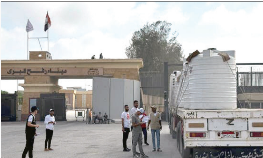
المواطن - وكالات

التفتيش والتدقيق مع إشراف صهيوني عن بعد فقط، وفق ما نقلت إذاعة الجيش الصهيوني، كما أشارت إلى أن «الدخول من مصر إلى غزة سيتم على مرحلتين: تفتيش أولي من قبل بعثة الاتحاد الأوروبي، ثم تفتيش أمني صهيوني داخل منطقة خاضعة للسيطرة الصهيونية بهدف منع التهريب أو دخول غير المصرح لهم». في حين لم يحدد بعد العدد النهائي للمغادرين والعائدين، لكن التقديرات تشير إلى بضع مئات يومياً. إلى ذلك، كشفت المصادر أن الشباب سيوافق مسبقاً على أساس تقييم أمني على هويات الداخلين والخارجين. كما أضافت أنه «من المتوقع السماح أيضاً بخروج عناصر منخفضي المستوى من حركة حماس، ممن لا يشتبه بتورطهم في جرائم قتل، بالإضافة إلى أفراد عائلات عناصر الحركة». وكان علي شعث، رئيس اللجنة الفلسطينية الانتقالية المدعومة من الولايات المتحدة والمكلفة بإدارة غزة مؤقتاً، أعلن يوم الخميس الماضي أنه من المتوقع إعادة فتح معبر رفح قريباً. واستشهد مواطنان فلسطينيان حتفهما، صباح امس الثلاثاء، برصاص الجيش الصهيوني في حي التفاح بمدينة غزة. وأفادت وكالة الأنباء والمعلومات الفلسطينية (وفا) بأن «طيران الاحتلال شن غارات جوية، فجر الثلاثاء، على مدينة رفح جنوباً، بالتزامن مع إطلاق نار كثيف من الآليات العسكرية». وأشارت إلى أن «مدفعية الاحتلال قصفت المناطق الشرقية من مدينتي غزة، وخان يونس»، لافتة إلى أن «بحرية الاحتلال هاجمت مراكب الصيد وسط إطلاق نار وقذائف في بحر خان يونس».