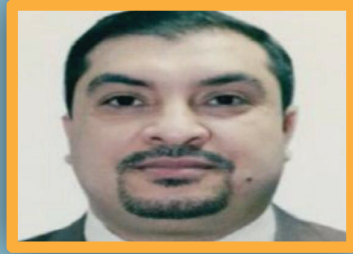
ص2 تمويل المشاريع الصغيرة في العراق: فرصة لتعزيز القطاع الخاص وتنوع الإيرادات غير النفطية

ص3 مسؤول قطاع الرصافة الجنوبي يعقد اجتماعا موسعا لتحسين الأداء وخدمة المواطن