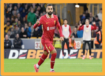
ليفربول يدرس التضحية بصلاح.. وراتب فلكي ينتظره في النصر