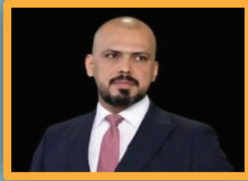
2ص فقه البقاء: حتمية الواقعية السياسية في العراق

3ص مجلس القضاء يستعرض مسودة الدليل الإرشادي لتوثيق الاعتداءات الجنسية