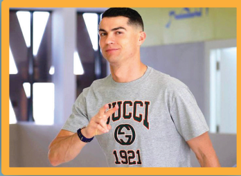
رونالدو يفرد بـ(عقلية النصر) عقب انتهاء الأزمة