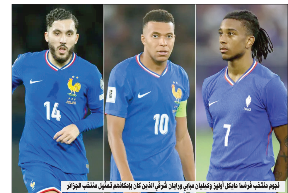
نجوم منتخب فرنسا مايكل أوليزر وكيليان مبابي ورايان شرقي الذين كان بإمكانهم تمثيل منتخب الجزائر

كشف مايكل أوليزر، لاعب خط الوسط الفرنسي ونجم بايرن ميونخ الألماني، عن الأسباب التي دفعته لاختيار تمثيل فرنسا دولياً بدلاً من الجزائر. وعلى الرغم من ارتباطه بعدة دول بسبب أصوله المتعددة، أكد أوليزر أن قراره نابع من رغبته في تحقيق حلم الطفولة. وفي تصريح لـ فوت ميركاتو، وصف أوليزر اختياره اللعب لفرنسا بأنه "أمر طبيعي". فقد ولد في إنجلترا لأب نيجيري وأم فرنسية-جزائرية، وكان بإمكانه تمثيل الجزائر أو نيجيريا أو إنجلترا أيضاً، لكنه شعر دائماً بأن فرنسا هي الفريق الذي يريد أن يلعب له. وأضاف "لطالما شعرت برغبة عميقة في اللعب لفرنسا". ولم يأت اختيار فرنسا بشكل منفصل عن علاقاته بشخصيات بارزة في الكرة الفرنسية، حيث ذكر بشكل خاص باتريك فييرا الذي دربه في كريستال بالاس، وتيري هنري، مدربه في منتخب فرنسا للشباب، معتبراً أن هذه التجارب عززت تعلقه بالمنتخب الفرنسي. ورغم اختياره فرنسا، لم ينس أوليزر جذوره الجزائرية. فقد نشأ وهو يزور الجزائر بانتظام، مما مكّنه من بناء روابط قوية مع الثقافة والتقاليد المحلية، والتي يصفها بأنها جزء مهم من هويته. ويشير