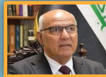
كيف يقرأ الدرس البريطاني الأخير في العراق :

3 ص الموارد تباشر حملة كبرى لتنظيف نهر الفرات في ذي قار