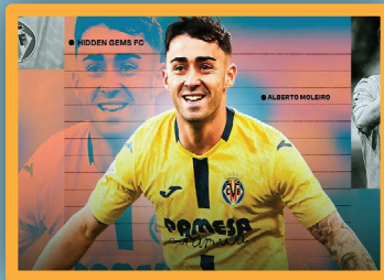
«بيدري الجديد» الذي يسعى جاهداً إلى صنع اسم نفسه