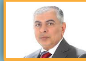
الإطار التسيقي... من تحالف الضرورة إلى أزمة البقاء

طقس العراق.. أجواء متباينة وتفاوت في درجات الحرارة