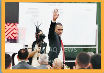
رسمياً.. يونس محمود رئيساً للاتحاد العراقي لكرة القدم