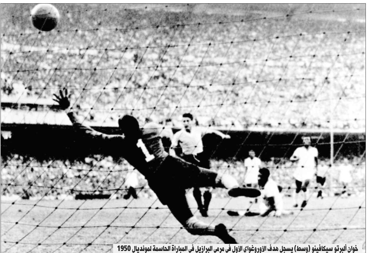
خوان ألبيرتو سيكافينو (وسط) يسجل هدف الأوروغواي الأول في مرمى البرازيل في المباراة الحاسمة لمونديال 1950

الظهير الأيسر بيغودي كيش فداء للصحافة، بعد أن راوغه غيدجا مرتين قبل التسجيل "فكرت بالانتحار، كان هذا الخيار الأنسب لي. ثم قلت في نفسي، حتى في مماتي، فإن الناس الظهير الأيسر بيغودي كيش فداء للصحافة، بعد أن راوغه غيدجا مرتين قبل التسجيل "فكرت بالانتحار، كان هذا الخيار الأنسب لي. ثم قلت في نفسي، حتى في مماتي، فإن الناس