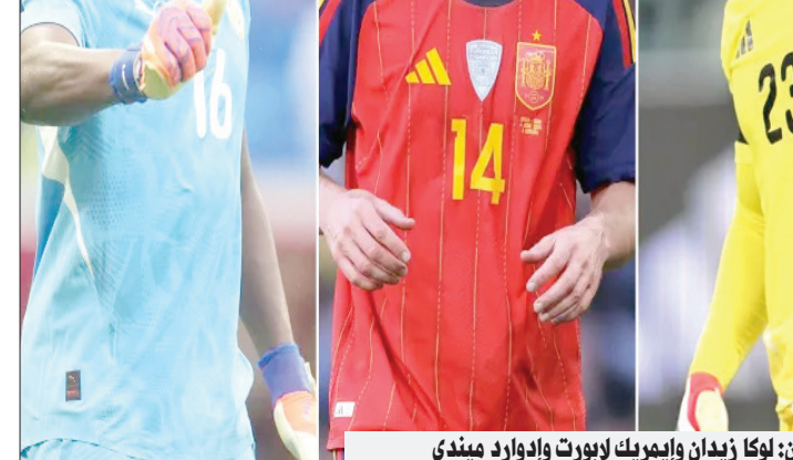
من اليمين: لوكا زيدان وإيمريك لوبورت والدوارد ميندي

الأرجنتين، النمسا، البرازيل، وسويسرا بـ 30 لاعباً لكل منهم