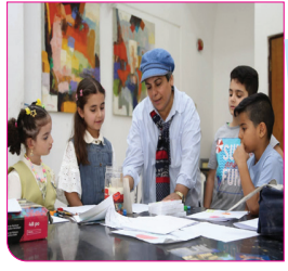
المرسم الحر بدائرة الفنون ينظم دورة لتعليم أساسيات الرسم للأطفال