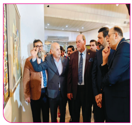
نقيب الفنانين العراقيين يخضع افتتاح معرض فضاء لوئي

المهم رحاله على جدار من جدران القصر الحكومي..