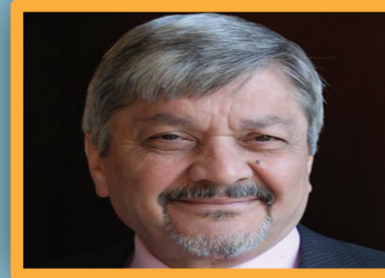
2 ص قطر والعراق بعد 2003: بين دبلوماسية الطاقة وإشكالية الإعلام

3 ص الدفاع المدني: السيطرة على حريق اندلع في مجمع تجاري بالكردية