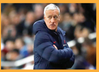
ديشأب يحذر لاعبي فرنسا من العراق: منضبطون تكتيكياً ولديهم رد