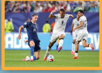
نجوم العراق ومدبرهم بعد موقعة فرنسا بأخطاؤنا كلفتنا الكثير وسنقاتل أمام السفن