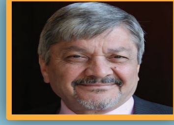
السعودية بعد 2003: دروس من تجربة أرامكو وإشكالية أنبوب التصدير النفطي العراقي