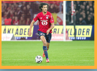
عملاق جديد يدخل سباق خطف موهبة المغرب الذهبية