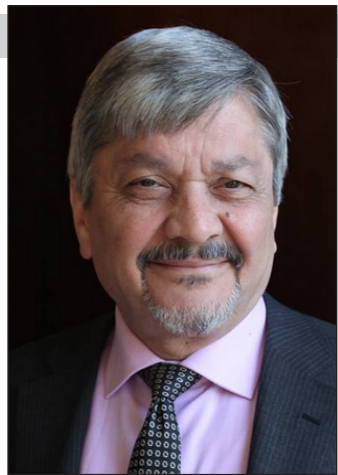
١- تركيا والغاز العراقي

١٩٧٣، والتي نصت على إنشاء خط لنقل النفط الخام من حقول كركوك إلى ميناء جيهان على البحر المتوسط بطاقة تصميمية بلغت نحو ٧٠٠ ألف برميل يوميا. وقد مثل هذا المشروع آنذاك أحد أهم المنافذ الاستراتيجية لتصدير النفط العراقي. وبعد نحو عقد من الزمن، وتحديدًا عام ١٩٨٣، جرى توقيع اتفاقية ثانية لإنشاء خط مواز على المسار نفسه، لترتفع الطاقة الإجمالية للخطين إلى نحو ١,٦ مليون برميل يوميا. ومنذ ذلك الحين شكّل الخط العراقي-التركي نموذجا عمليا لمشاريع الطاقة العابرة للحدود التي تحقق مصالح مشتركة للعراق وتركيا، رغم ما شهدته العلاقات الثنائية