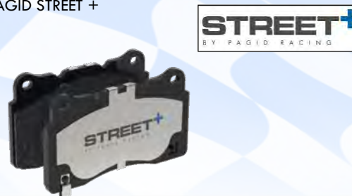
PAGID STREET +