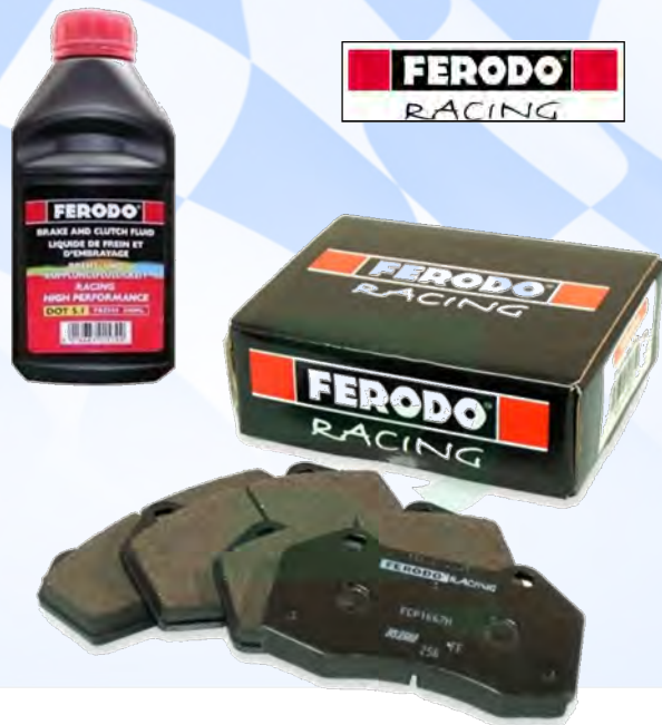
PASTILLAS DE FRENO FERODO RACING