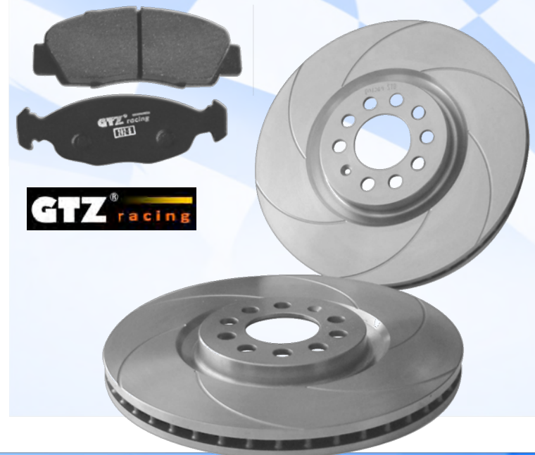
DISCOS & PASTILLAS DE FRENO GTZ RACING