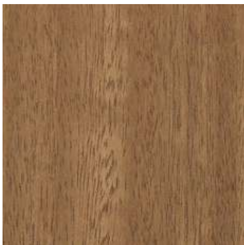
NG20 - NOGAL CLARO