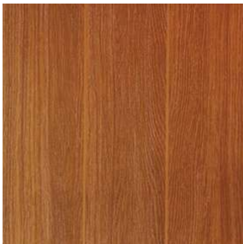
CD10 - CEDRO