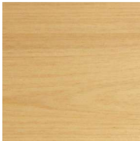
NT50 - NATURAL