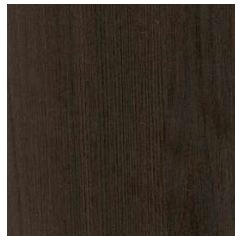
NG22 - NOGAL