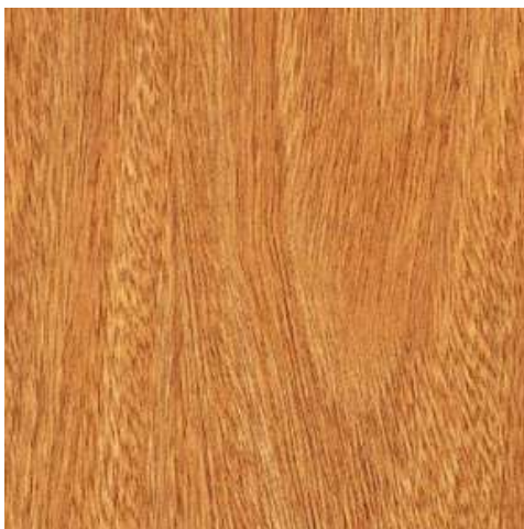
CL40 - COLONIAL