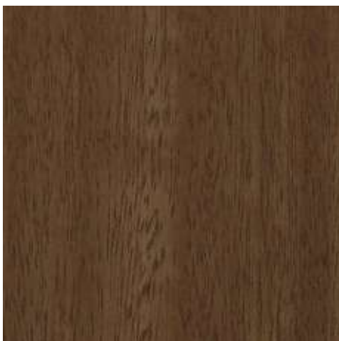
NG21 - NOGAL INTERMEDIO