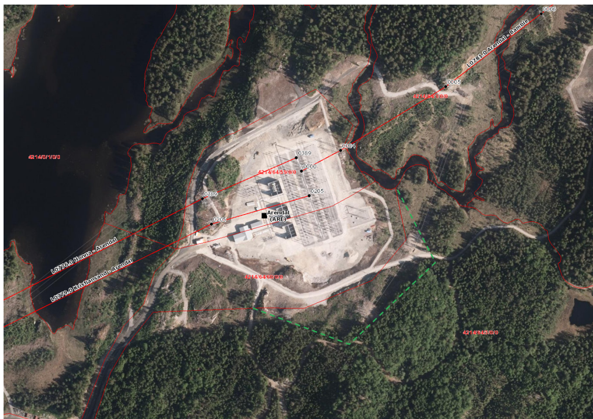
Figur 2 - grønn stiplet strek viser Statnetts antatte fremtidige arealbehov sør for dagens eiendomsgrense. I tillegg vil det være behov for å sikre ledningstraséer for ny 420 kV ledning mot Kristiansand sør for dagens ledning mot Kristiansand, samt ledningstrase mot Bamble på nordsiden av dagens ledningstrase mot Bamble ut fra stasjonen.