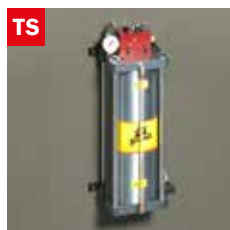
Dispositivo taglio a secco Dry cooling device