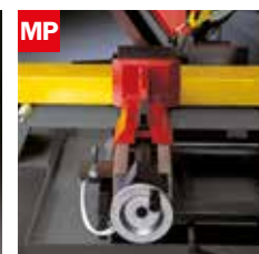
Morsa pneumatica Pneumatic vice