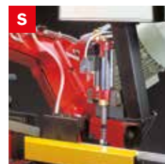
Skip elettrico Electrical skip