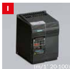
Inverter Frequency converter