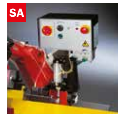
Discesa controllata Gravity down feed