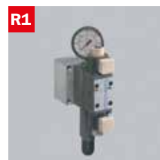
Reg. pressione morse Adjustable vice pressure