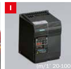
Inverter Frequency converter