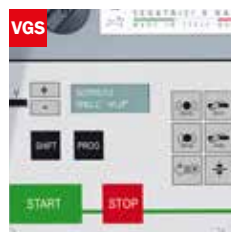
Visualizzatore gradi angolo di taglio Cutting angle display