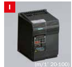
Inverter Frequency converter