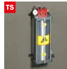
Dispositivo taglio a secco Dry cooling device