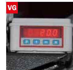
Visualizzatore gradi angolo di taglio Cutting angle display