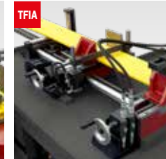
Taglio fascio oleodinamico Hydraulic bundle clamping device