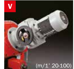
Motovariatore Blade speed variator