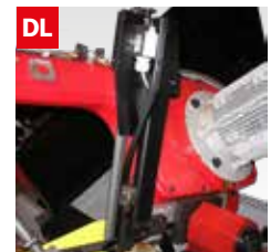
Dispositivo controllo deviazione lama Blade deflection control device