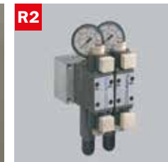
Reg. pressione morse doppio Adjustable vice pressure