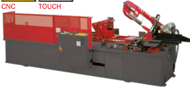
IMMAGINE DIMOSTRATIVA, MACCHINA VENDUTA CON CARTER DI PROTEZIONE COMPLETO. (VEDI MODELLO 370 A DS 1R).

IMAGE FOR DEMONSTRATION PURPOSES ONLY. THE MACHINE WILL BE SOLD WITH ALL THE PROTECTIVE COVERS. (SEE MOD. 370 A DS 1 R PICTURE).