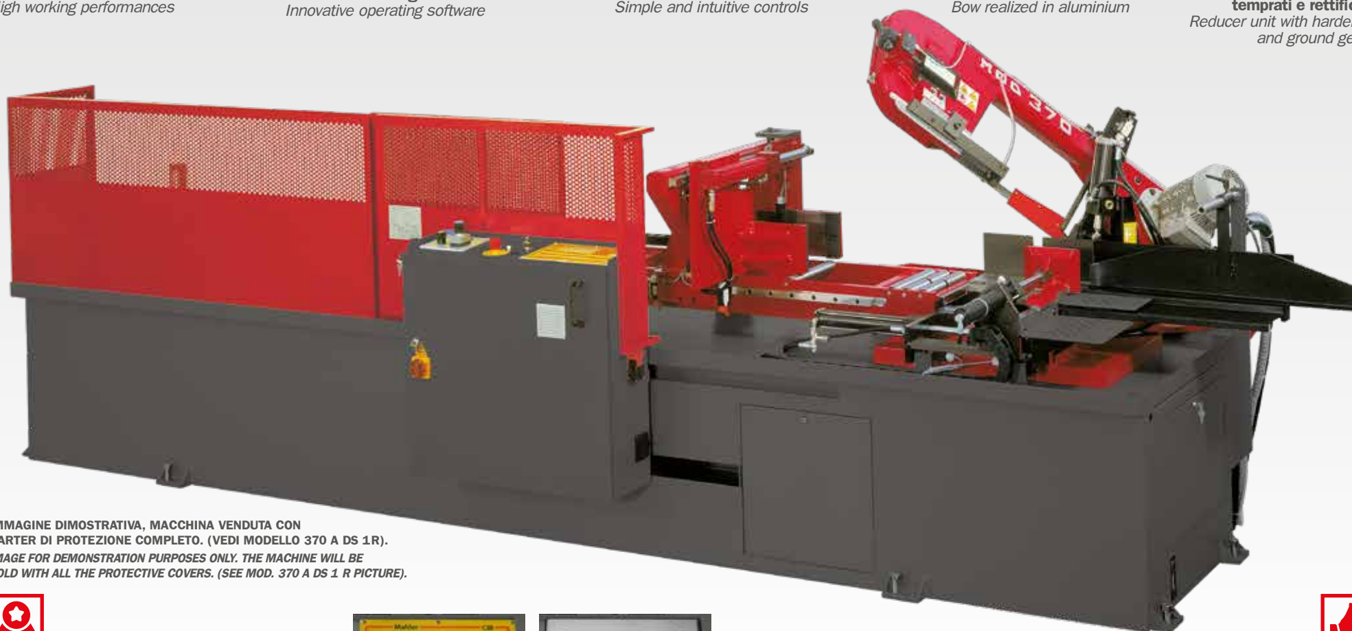
IMMAGINE DIMOSTRATIVA, MACCHINA VENDUTA CON CARTER DI PROTEZIONE COMPLETO. (VEDI MODELLO 370 A DS 1R). IMAGE FOR DEMONSTRATION PURPOSES ONLY. THE MACHINE WILL BE SOLD WITH ALL THE PROTECTIVE COVERS. (SEE MOD. 370 A DS 1 R PICTURE).

Riduttore con ingranaggi temprati e rettificati Reducer unit with hardened and ground gears