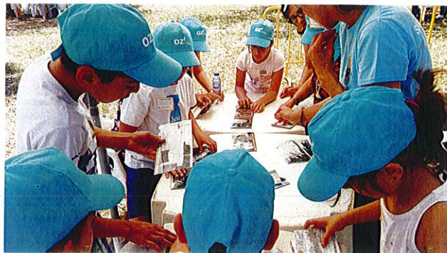
POTL "Férias na Aldeia"