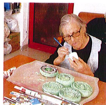
Atividades Expressão Plástica

Centro de Apoio a Idosos de Moreanes - IPSS