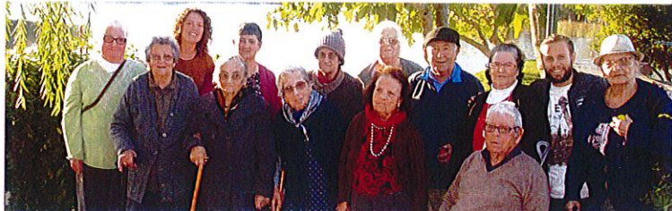
Visita á Mina S. Domingos