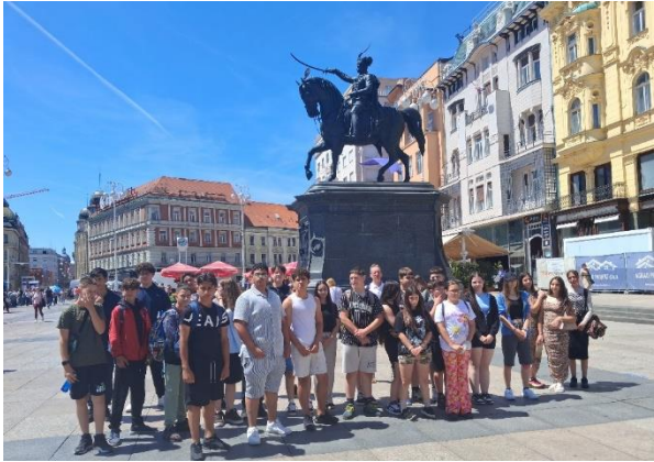
Jellasics bán tér