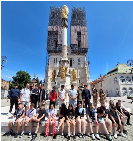
Mária-oszlop és a Zágrábi katedrális