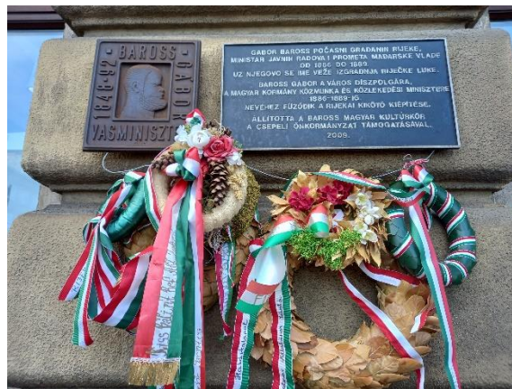
megkoszorúzott Baross tábla