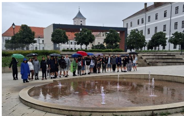
Vatroslav Lisinski tér