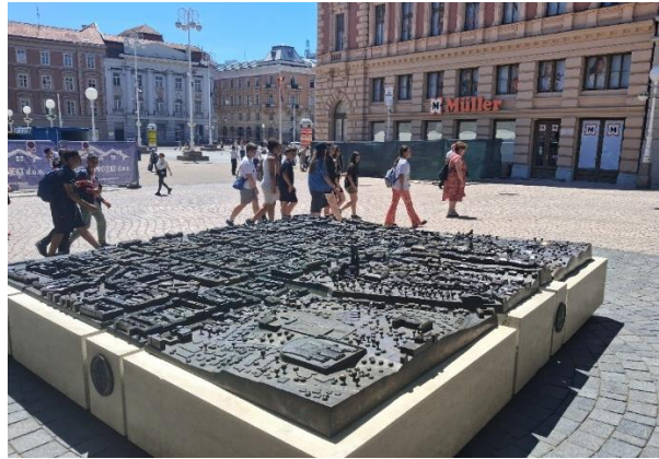
Zágráb belvárosának makettja