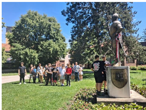
IV.Zrínyi Miklós szobra