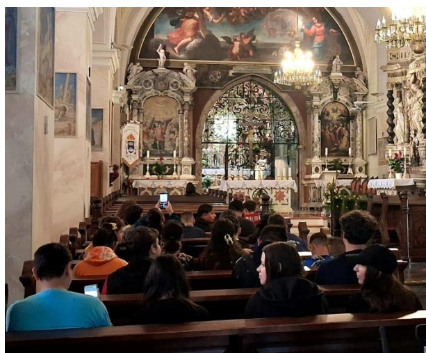
Trsati Szűz Mária-kegyhely bazilikája

Megismerkedtünk Fiume történelmi belvárosával, a korzón található Óratoronnyal, a kikötővel és annak magyar felirataival. A magyar időben épült a piac, a színház, és egyéb fontos épületek: a Kormányzói Palota, a Magyar Királyi Tengerészeti Hatóság épülete, az Adria-palota és az Adria Magyar Királyi Tengerhajózási Rt. székháza. Felkerestük a magyar feliratú kikötői bolyákat és a Baross emléktáblát, illetve Jókai emlék tábláját. Majd pedig megnéztük az római időkből megmaradt “öreg kaput”. Megtekintettük Szent Víd, a város védőszentjének a templomát, ahol Feszty Árpád mennyezőjét is tartották és amely a 100 kunáson is, mígnem be nem vezették az eurót. Ezután láthattuk a fiumei ferde tornyot is, valamint felkerestük a helyi Baross Gábor Magyar Kultúrkör Székházát.