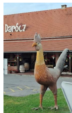
várdaróci tájház és a várdaróci kakas