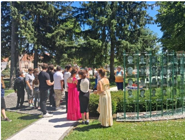
délszláv háború áldozatainak emlékműve

Csáktornyán sétát tettünk a Zrínyiek sásfészekben. A várban állították fel azt az obeliszket amely a vadász balesetben elhunyt Zrínyi Miklósnak állít emléket. A bejáratánál található „Zrínyi Péter búcsúja” emlékműnél felidéztek a Wesselényi-féle összeesküvés történetét, amely Zrínyi Péter és Frangepán Ferenc kivégzéséhez is vezetett. Innen az őrtorony hídja fele a Subics féle emléktáblát láthattuk, innen elsétáltunk a Szent Jeromos szlavóniai származás szentünk szobrához, a Zrínyi fához, Zrínyi teljes alakos szobrához, a honvédő háború áldozatainak emlékművéhez és a turulmadaras központi Zrínyi emlékoszlophoz.