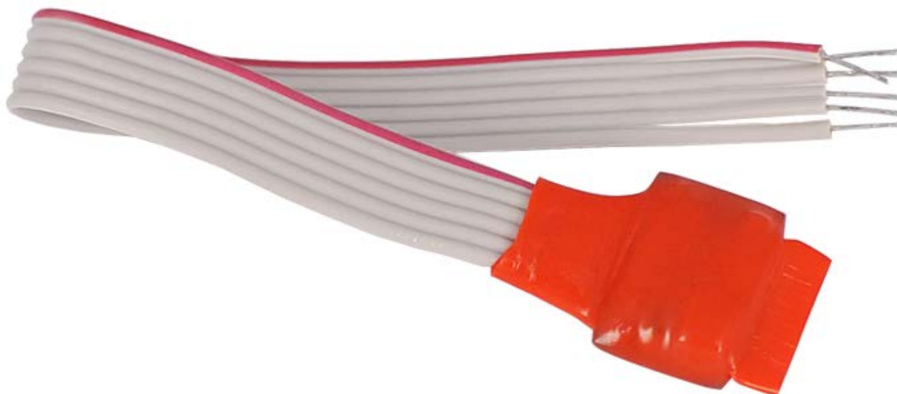
Рисунок 2.2.1 Внешний вид АР1

На рисунке 2.2.1 представлены внешний вид АР1.