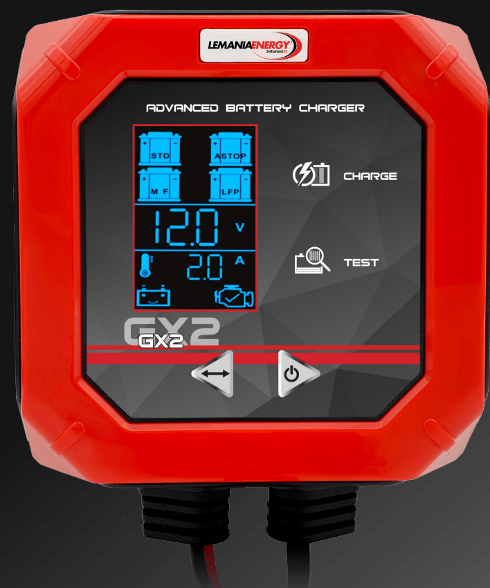
GX2 12V 2.0A