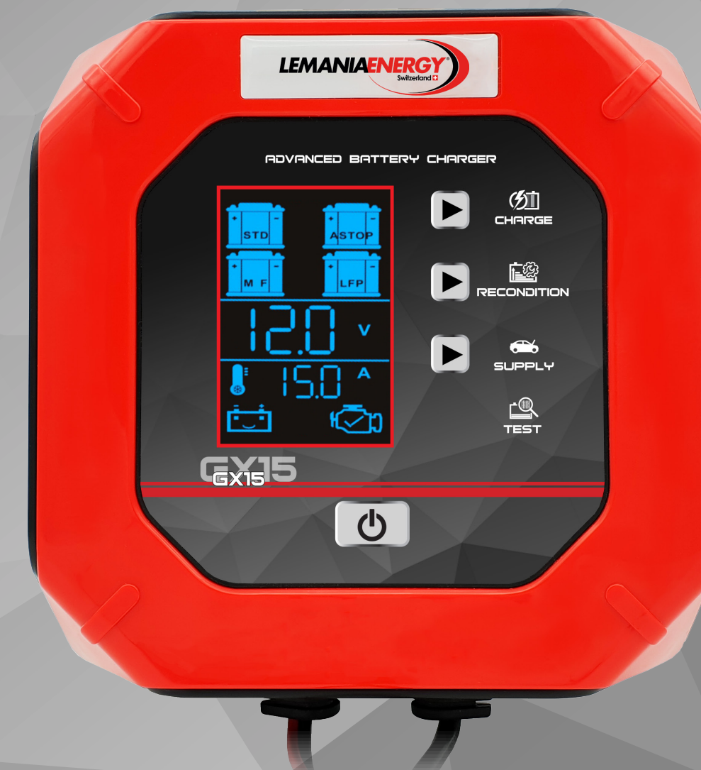
GX15 12/24V 15.0A

The GX is the Ultimate Battery Charging, support and Diagnostic Tool. Combine intelligent charging, maintenance, supply, reconditioning and testing into one simple process with this easy to use Advanced Battery Charger.