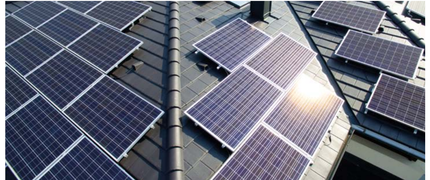
Klasszikus, nagypaneles szolárrendszer

Tartozzon Ön is azon vásárlóink közé, akik innovatív megoldásokat alkalmaznak otthonuk építésénél vagy felújításánál!