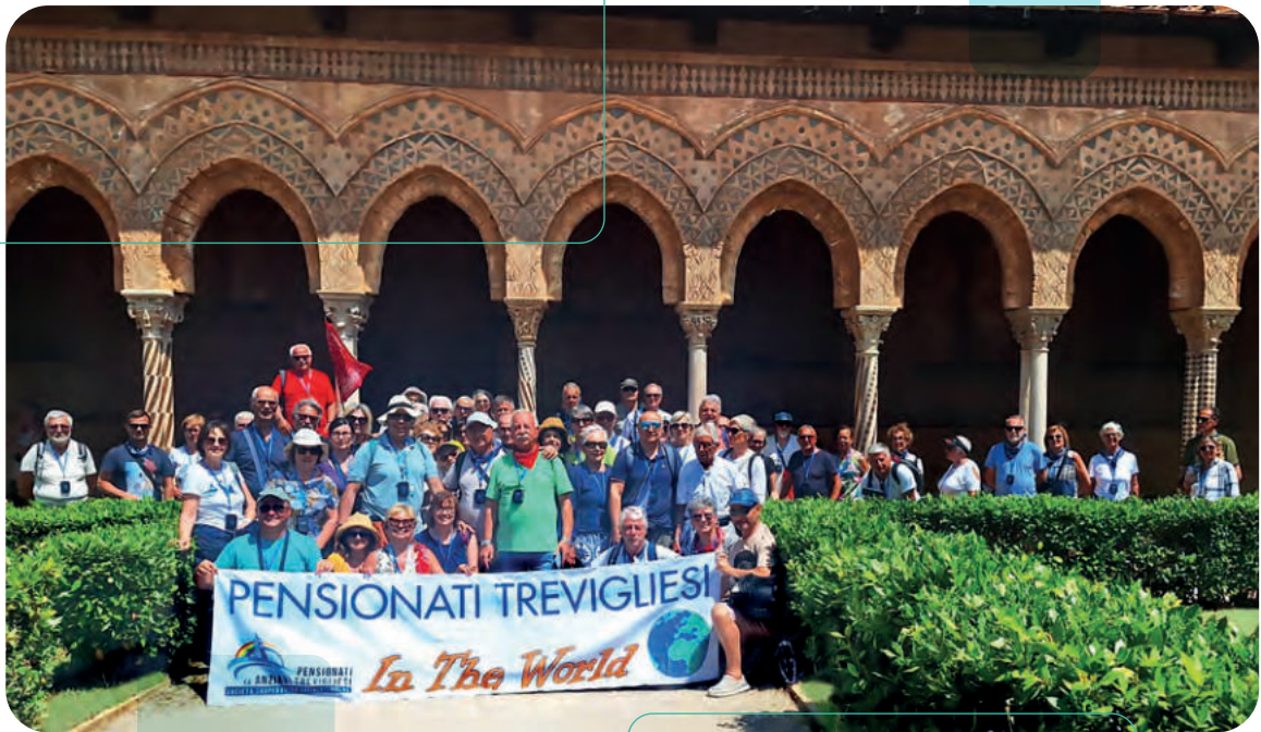
Palermo: chiostro di Monreale