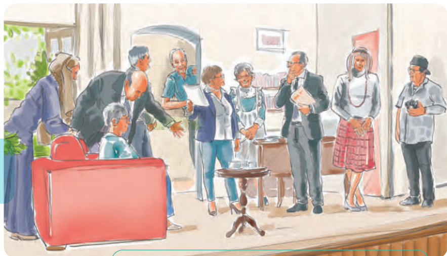
La compagnia teatrale