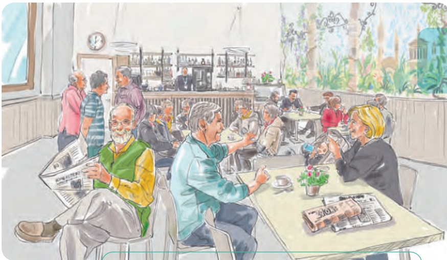
Il Salone Bar e delle Letture