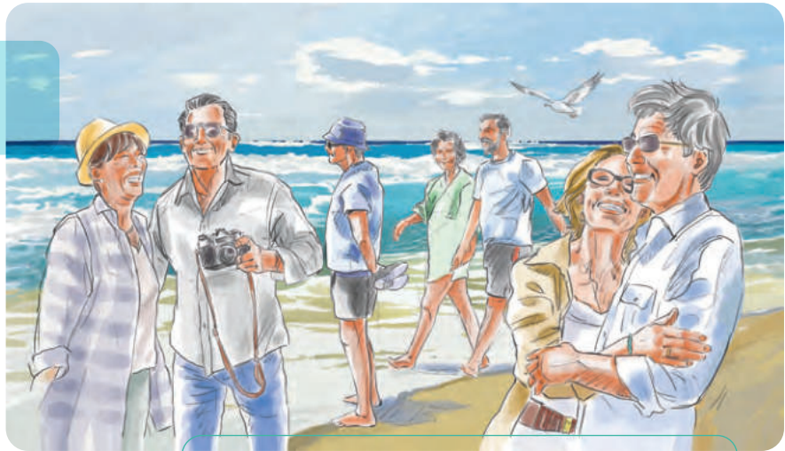
Le gite al mare