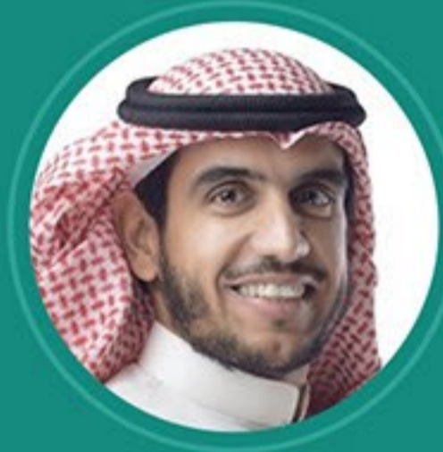
المنشد ابو علي العميرة