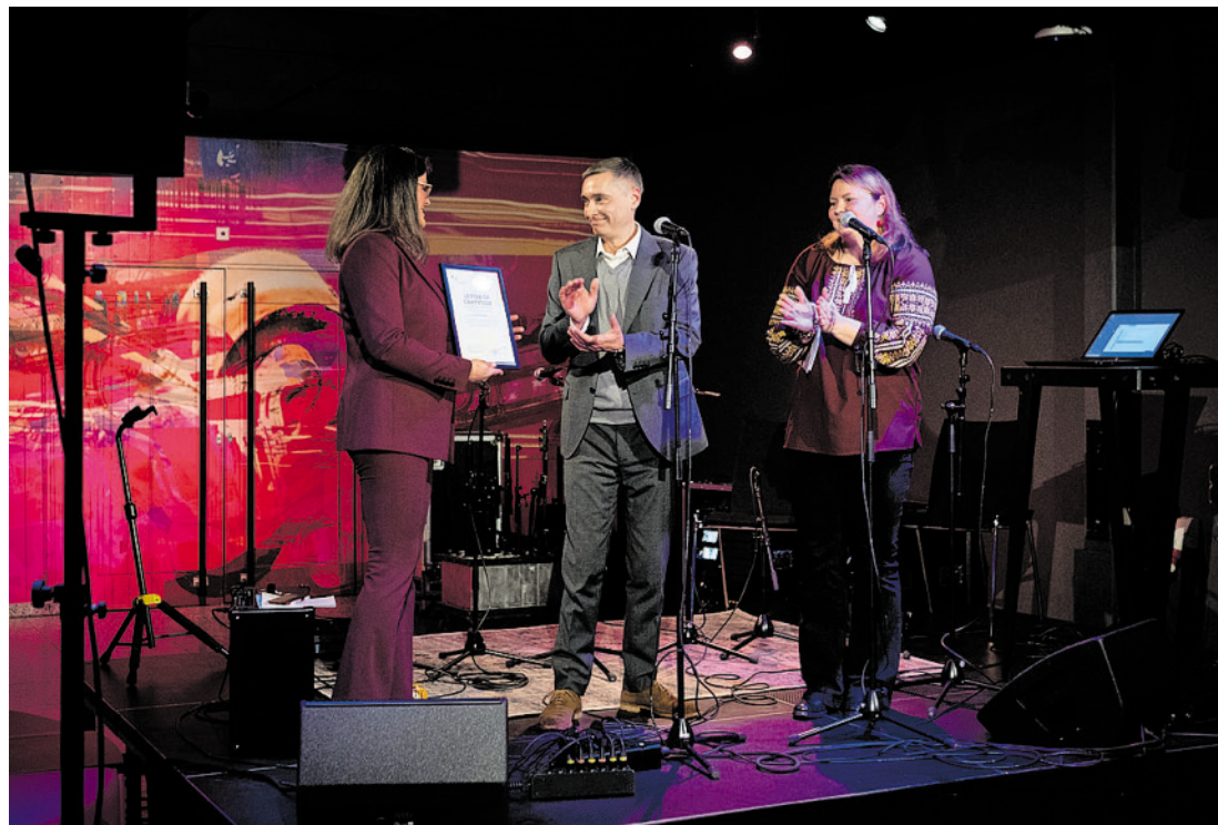
De opening van het Zhyttya Festival in de Oosterpoort in december: de viering van de Oekraïense cultuur.