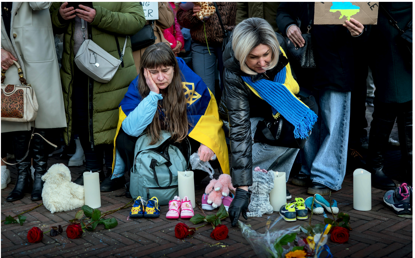
De bijeenkomst op de Grote Markt was emotioneel en trok meer dan duizend Stadjers en Oekraïners.

In groten getale spraken Stadjers zondagmiddag hun steun uit voor de Oekraïners die hun land zijn ontvlucht. Op de Grote Markt in Groningen stonden ze samen stil bij de Russische invasie, maandag precies drie jaar geleden.