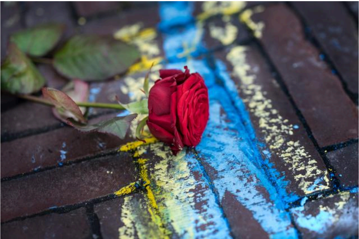
De Grote Markt lag bezaaid met rozen, kinderschoenen en knuffels.