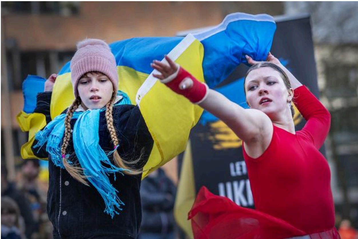
Een dansgroep uit Oekraïne voerde een dans op midden tussen de mensen.