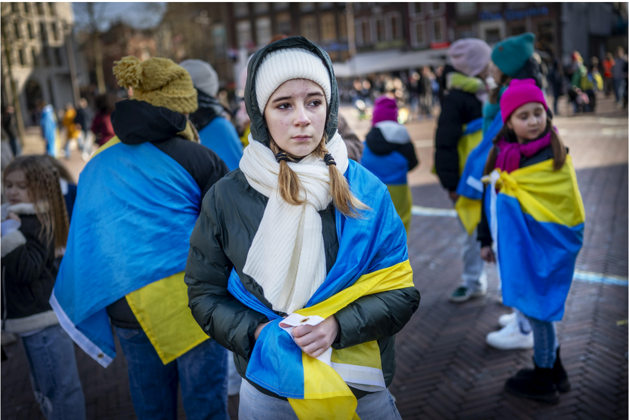
Het is maandag precies drie jaar geleden dat Rusland Oekraïne binnenviel.