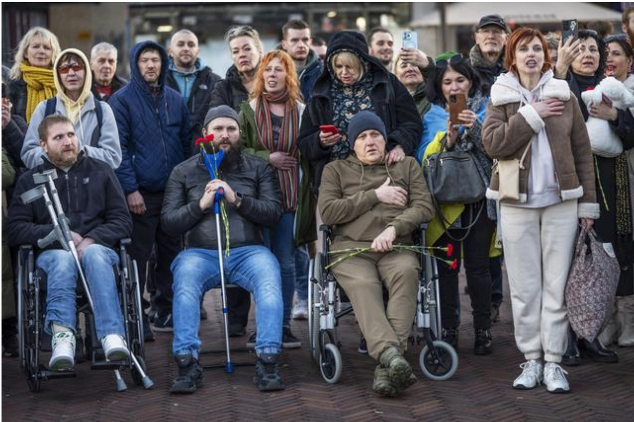
Een groep gewonde soldaten, hier het volkslied zingend, werkt in Groningen aan hun herstel.