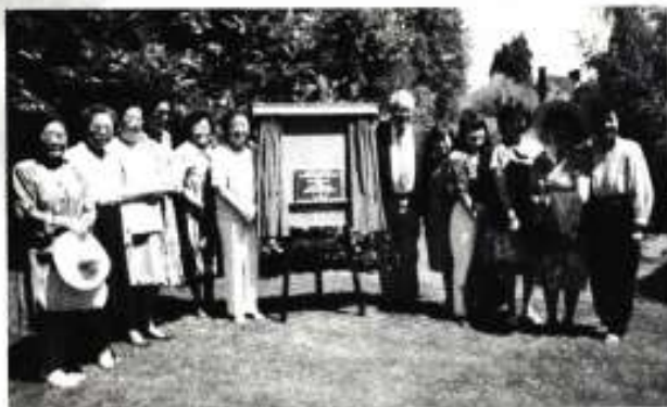
省督府植樹紀念1994年7月21日B.C.省督 林思齊博士，陳坤儀伉儷