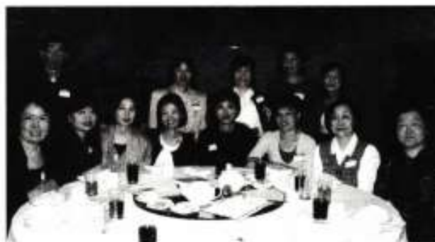
九龍及香港真光中學校友