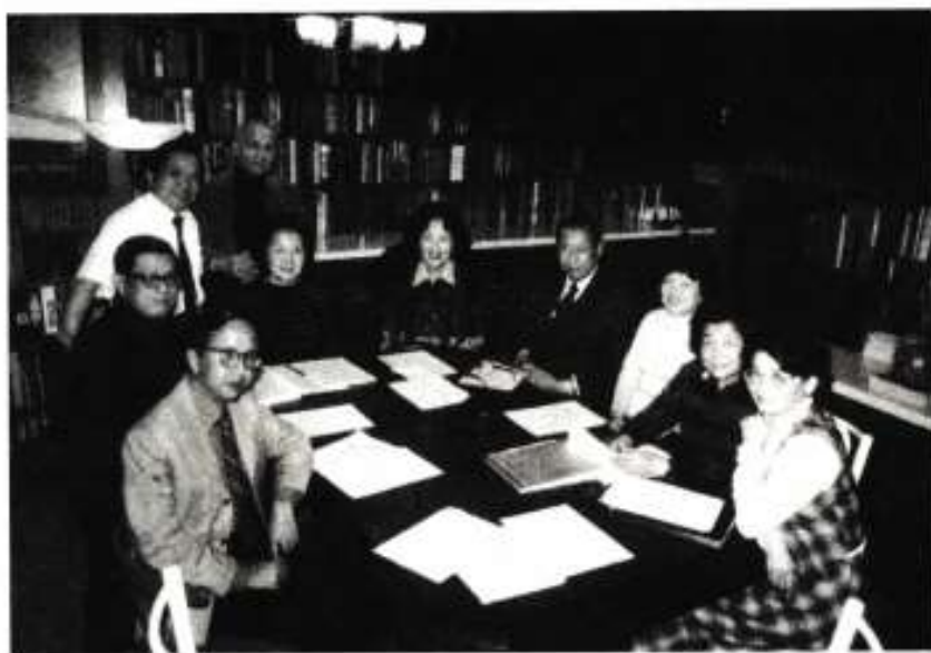
1982年溫哥華真光中文學校校董會