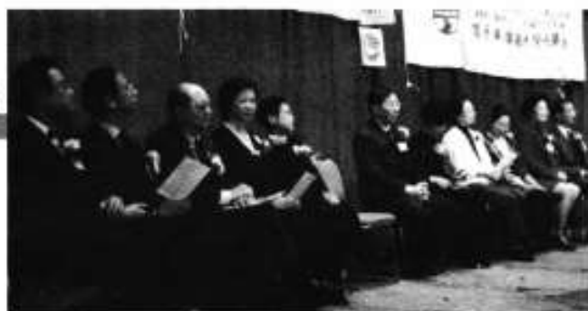
籌委會成員—各校友會代表