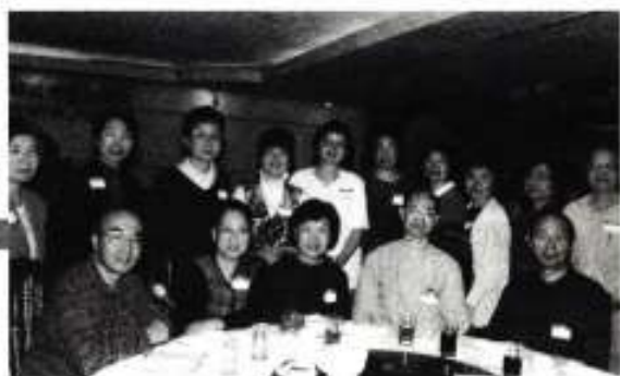
香港真光中學校友