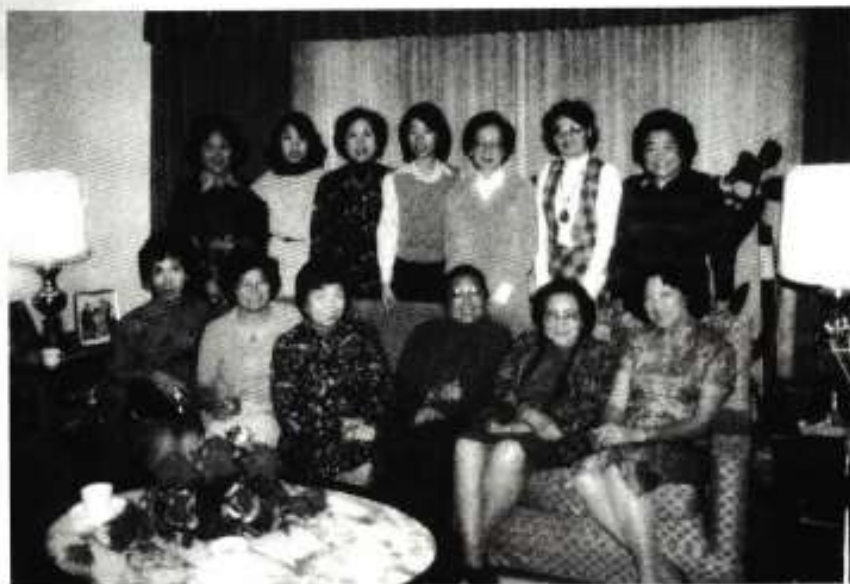
1982年溫哥華真光中文學校教職員