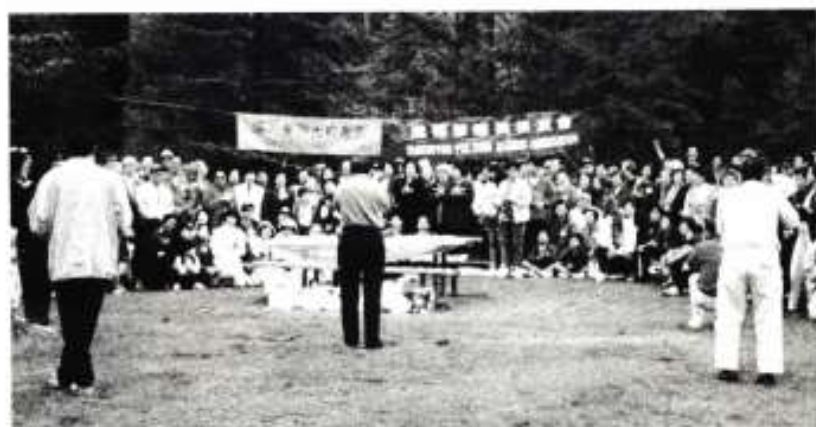
1999年7月25日聯合培英校友會合辦郊遊野餐 共300多人參加，真光約佔60人