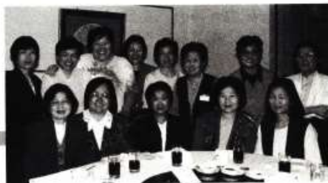
中文學校部份老師