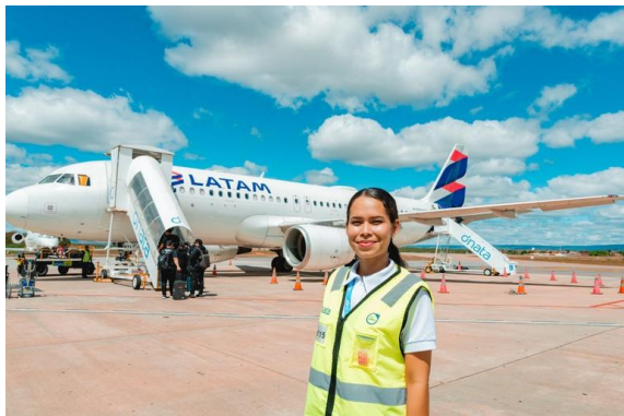
Aeroporto de Juazeiro do Norte-CE - Foto: Vosmar Rosa

Iniciativas abrem caminho para mulheres em áreas historicamente masculinas do setor aéreo