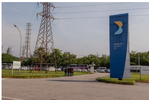
Fábrica da Braskem em Duque de Caxias (RJ) — Foto: Maria Magdalena Arrellaga / Bloomberg

A Braskem, maior empresa petroquímica do Brasil, está considerando entrar com pedido de proteção judicial contra credores, segundo fontes envolvidas nas negociações. A situação financeira da empresa piorou nos últimos meses, levando sua administração a considerar a medida cautelar — uma forma temporária de proteção contra credores — ou até mesmo entrar com pedido de recuperação judicial, disseram as fontes, com a ressalva de que nenhuma decisão final foi tomada