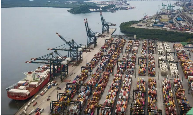
Vista aérea de parte do Porto de Santos

A Agência Nacional de Transportes Aquaviários (Antaq) autorizou a chilena Arauco a adquirir o controle acionário da sociedade Alempor e assumir a titularidade do Terminal de Uso Privado (TUP) no bairro de Alemoa, no Porto de Santos (SP). A estrutura será utilizada pela companhia para escoar a produção da megafábrica de celulose de eucalipto que está sendo construída em Inocência (MS).