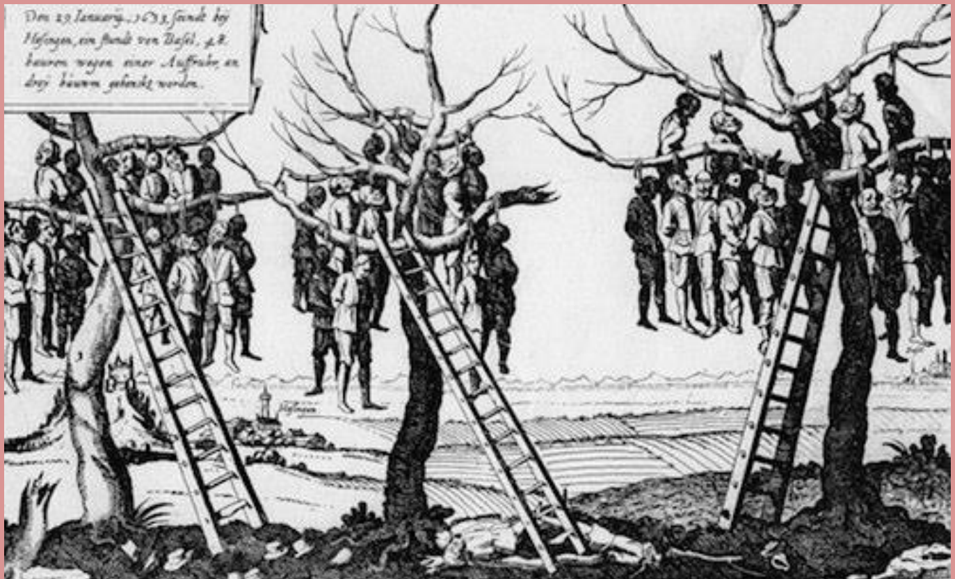
Les 41 meneurs furent pendus à Hésingue

notion de tactique stratégique tombèrent dans le guet-apens. Plus de 800 paysans gisaient sur le champ de bataille et autant furent capturés. 41 meneurs furent pendus aux arbres et le reste conduit à Landser où environ 600 périrent.