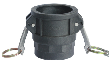
HEMBRA ROSCA MACHO Modelo LCM - BSP/NPT