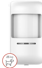
DPP143 גלאי נפח אלחוטי חסין חיות עד 25 ק"ג מק"ט 8831012

גלאי נפח אינפרה-אדום פאסיבי (PIR) אלחוטי, המתעלם מחיות בית במשקל של עד 25 ק"ג. טווח גילוי: 12 מ' טווח שידור: 500 מ' בשטח פתוח (בקו ראייה) סוללה: 3V CR123A, Lithium מידות: 11 X 5.5 X 5.5 ס"מ משקל: 110 גר' תחום טמפרטורה: C: -10° to +50°