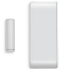
DCM143 גלאי פתיחה מגנטי ומשדר אוניברסלי אלחוטי מק"ט 8831002

גלאי פתיחה מגנטי אלחוטי להתקנה על דלתות, חלונות ופתחים אחרים, למתן התרעה מפני פתיחה. ניתן להתקין את הגלאי גם על דלתות מתכת. מכיל גם משדר אוניברסלי לחיבור גלאי חיצוני נוסף. סוללה: 2X 1.5V, AAA, Alkaline מידות: 8 X 15 X 1.5 ס"מ מגנט: 4 X 1 X 1.5 ס"מ משקל: 60 גר' תחום טמפרטורה: C: -10° to +50°