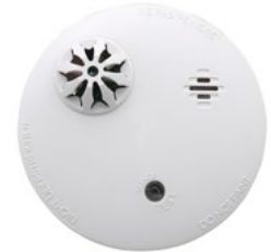
DSH143 גלאי עשן/חום אלחוטי מק"ט 8832002

גלאי משולב עשן אופטי/חום המיועד לתת התרעה אש ע"י השמעת אזעקה מהצופר המובנה בו ושליחת התרעה ללוח הבקרה של מערכת האזעקה. הגלאי מיועד לשימוש בדירות, בבתים ובמשרדים קטנים עד בינוניים. סוללה: 1X CR123A, Lithium, 3V מידות: קוטר - 12 ס"מ, עומק - 6.5 ס"מ משקל: 200 גר' תחום טמפרטורה: C: 0° to +50°