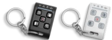
RMC143 שלט רחוק אלחוטי כולל לחצן מצוקה מק"ט 8833008 (שחור), 8833004 (לבן)

שלט רחוק אלחוטי עם חמישה לחצנים לדריכה ונטרול מערכת האזעקה, (דריכת מערכת מלאה ומצבי בית שונים) והפעלת לחצן מצוקה. יכול לשמש גם להפעלת אביזרים שונים, כגון שער חשמלי. נורית לחיווי בכל שידור ובמצב של סוללה נמוכה עיצוב מודרני, בצבעים לבן או שחור. מגיע עם מחזיק מפתחות סוללה: 3V CR2032, Lithium מידות: 5.5 X 3.5 X 1.2 ס"מ משקל: 35 גר' תחום טמפרטורה: C: -10° to +50°