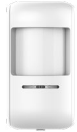
DPS143 גלאי נפח אלחוטי מק"ט 8831010

גלאי נפח אינפרה-אדום פאסיבי (PIR) אלחוטי טווח גילוי: 12 מ' טווח שידור: 500 מ' בשטח פתוח (בקו ראייה) סוללה: 3V CR123A, Lithium מידות: 11 X 5.5 X 5.5 ס"מ משקל: 110 גר' תחום טמפרטורה: C: -10° to +50°