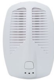
DGS143 גלאי גז אלחוטי מק"ט 8832004

DGS143 מיועד להתריע בעת גילוי גז פחמימני מעובה ע"י השמעת צפצופי אזעקה מהזמזם המובנה בו, ושליחת אות אזעקה ללוח הבקרה של מערכת האזעקה. הגלאי מיועד לשימוש בדירות, בבתים ובמשרדים קטנים עד בינוניים. מופעל ע"י שניא חיצוני המחובר למתח רשת (230V), ומכיל סוללת גיבוי לדיווח על נפילת מתח רשת וחזרתו. תכונות עקריות: גילוי גז, דיווח אותות אזהרה, ובדיקת אבחון עצמית לשמירה על ניטור רצוף. סוללה: 1X CR123A, 3.0VDC, Lithium מידות: 11.9 X 8 X 4.4 ס"מ משקל: 200 גר' תחום טמפרטורה: C: -10° to +50°