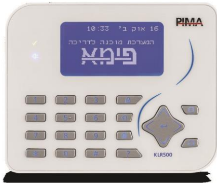
לוח מקשי גומי דק במיוחד (KLR500) מק"ט פימא 8415001

לוחות המקשים של סדרת ה-FORCE דקים ואלגנטיים במיוחד ומתאפיינים במסך LCD גדול בעל 7 שורות, מסכי עזרה הנגישים מכל נקודה בתפריט ותאורה הניתנת להתאמה לפי הצורך ( מומלץ מקשי גומי )