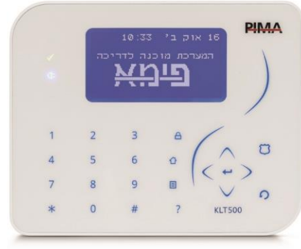
לוח מקשי מגע דק במיוחד (KLT500) מק"ט פימא 8415010