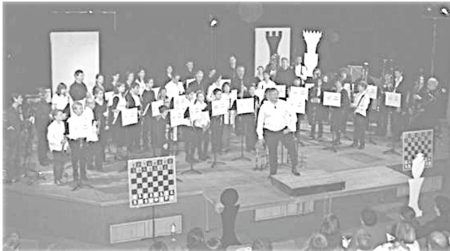
Concert en blanc et noir aux multiples couleurs de la famille des Philidor

Ce Samedi 1 o Décembre, l'Hôtel de ville de Levallois voit sa quiétude de début d'après – midi troublée par l'arrivée de hautboïstes et bassonistes d'âges divers. Petit à petit, la grande salle, toute ornée de dorures, de lourds rideaux et de planchers superbes se