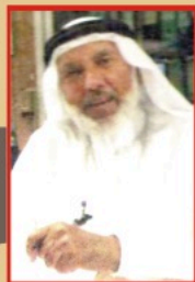
Khan Sahab Chief Executive

P.O.Box: 6338, Industrial Area # 5 Sharjah Tel:+971-6-5434095