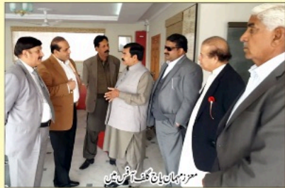
موزمبان یانچ گلف آئیں