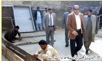
موزمبان یانچ گلف فریڈیسٹ کا سٹارٹ کرتے ہیں