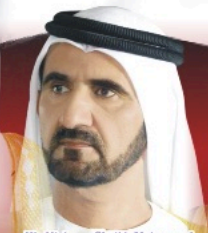
His Highness Shaikh Mohammed bin Rashid Al Maktoum, Vice-President and Prime Minister of the UAE and Ruler of Dubai