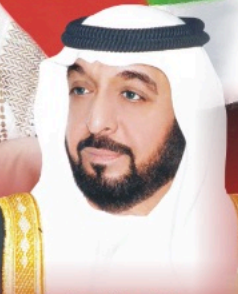
The President His Highness Shaikh Khalifa bin Zayed Al Nahyan

44th Anniversary of the United Arab Emirates