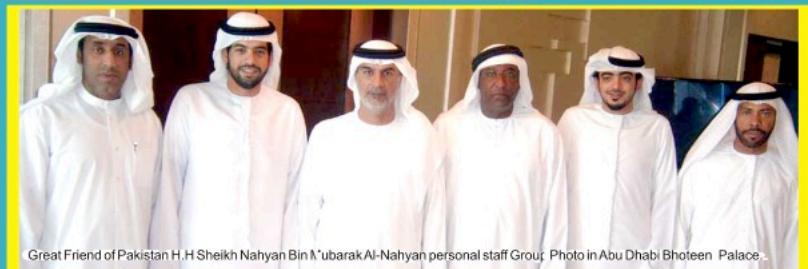
Great Friend of Pakistan H.H Sheikh Nahyan Bin Mubarak Al-Nahyan personal staff Group Photo in Abu Dhabi Bhteem Palace.