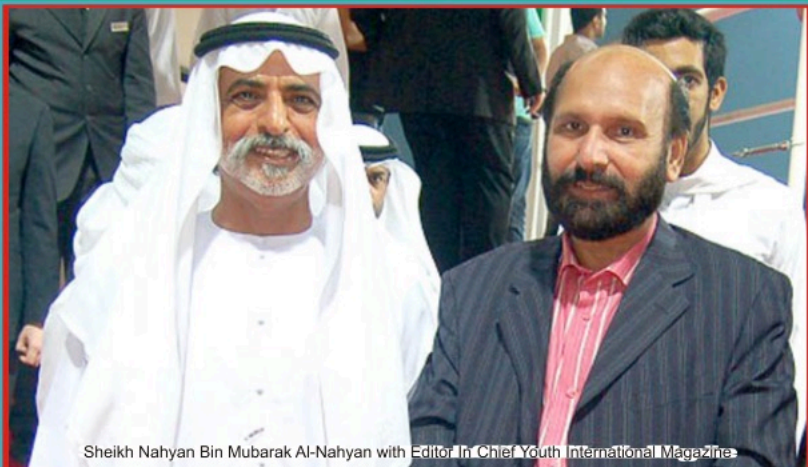
Sheikh Nahyan Bin Mubarak Al-Nahyan with Editor In Chief Youth International Magazine