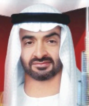
His Highness Shaikh Mohammed bin Zayed Al Nahyan Crown Prince Abu Dhabi Deputy Supreme Commander U.A.E Armed Forces

ہوئے اے ای کے 44 ویں قومی دن کے موقع پر اپنے شخصیات کے پیغامات