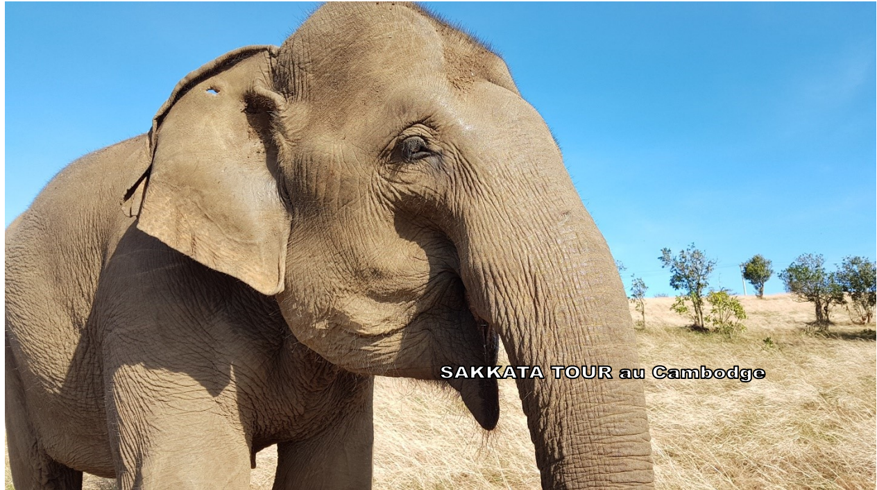
Photo : Le trek avec les éléphants dans la jungle de Mondulkiri

Une journée fantastique vous attend : une randonnée en compagnie des éléphants dans la forêt protégée. Ce matin, rendez-vous avec notre partenaire de la communauté ethnique Phnong à votre lodge. Un court trajet en véhicule vous mènera au point de départ de la randonnée.