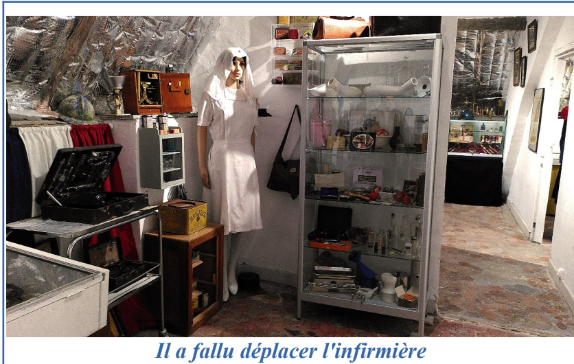
Il a fallu déplacer l'infirmière