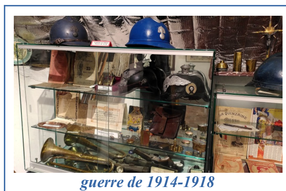
guerre de 1914-1918