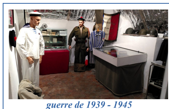
guerre de 1939 - 1945