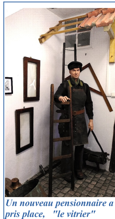
Un nouveau pensionnaire a pris place, "le vitrier"

Les deux tableaux confiés à la restauration devraient retrouver leur place pour les journées Européennes du patrimoine.