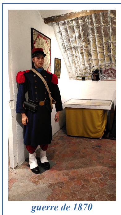
guerre de 1870

La période des congés d'été a été mise à profit pour mettre en état, du sol au plafond, les trois espaces qui accueillent les 3 conflits 1870, 1914-1918 et 1939-1945.