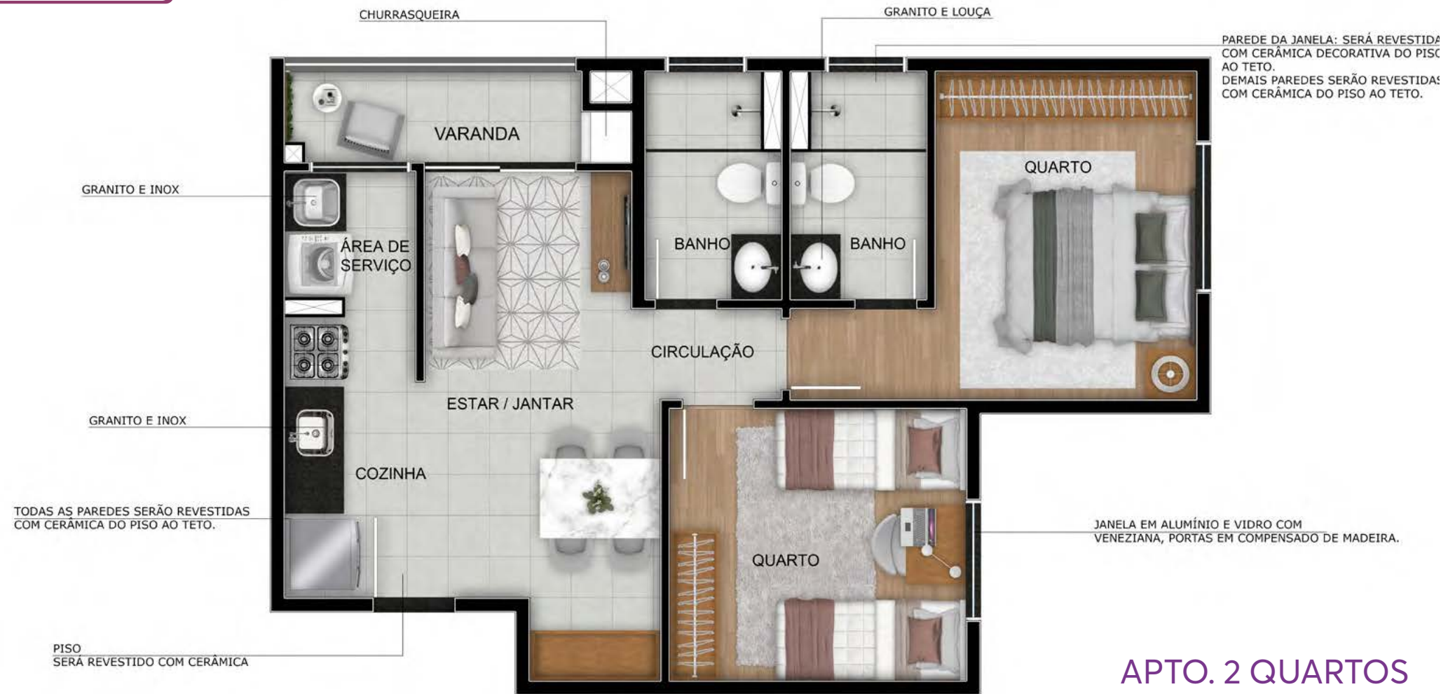
FIORENTTINO RESIDENCE - PLANTA APTO 202 - TORRE 01