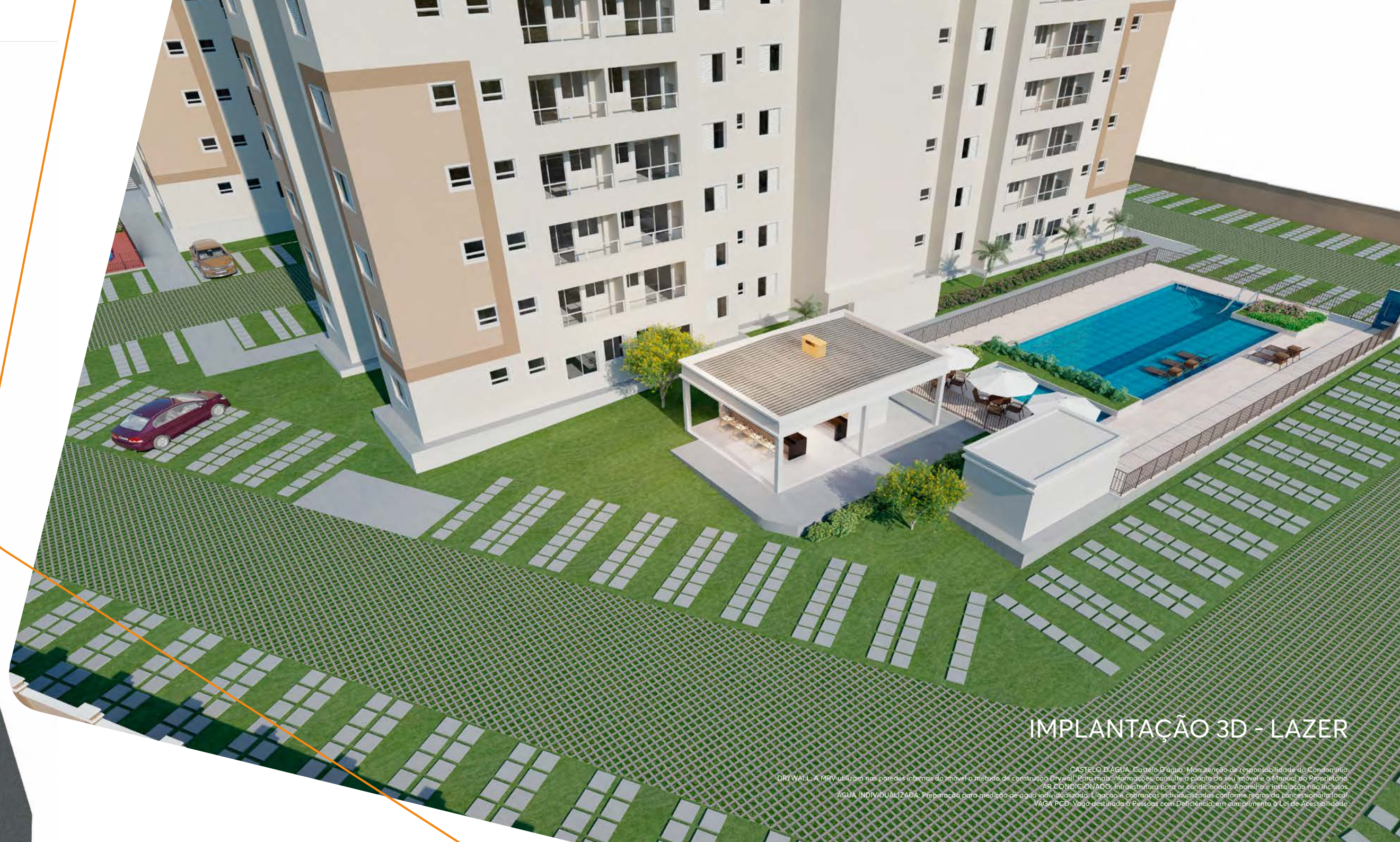
IMPLANTAÇÃO 3D - LAZER