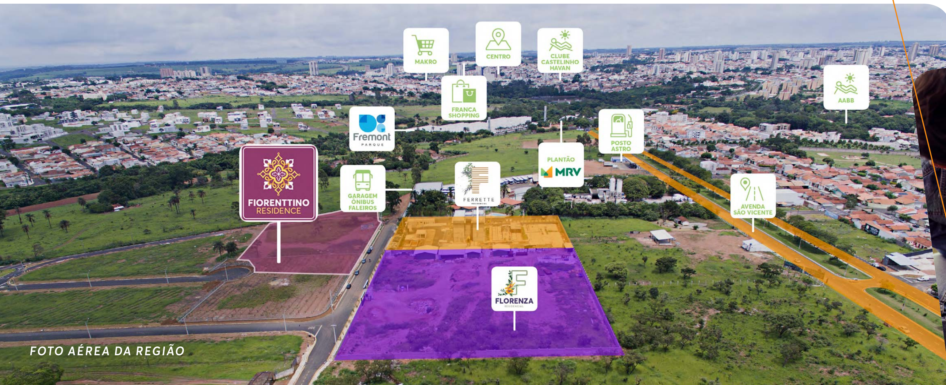
FOTO AÉREA DA REGIÃO