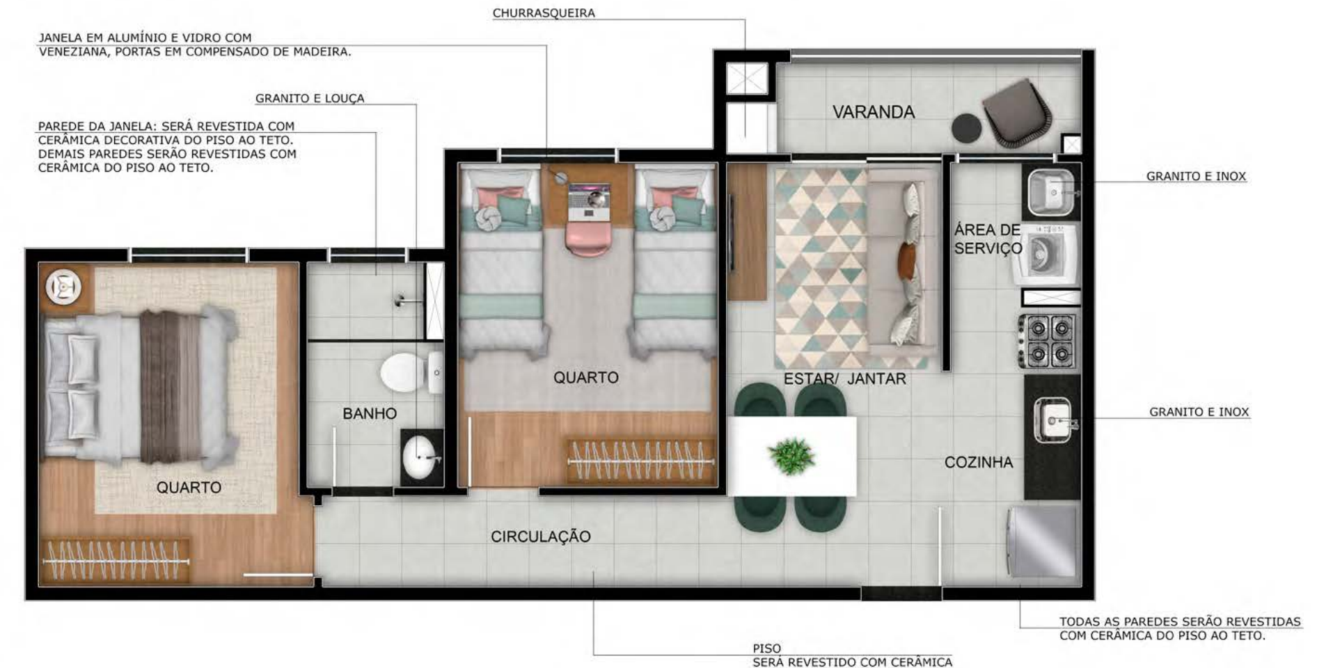
FIORENTTINO RESIDENCE - PLANTA APTO 204 - TORRE 01

Imagem ilustrativa com sugestão de decoração. Os móveis, objetos, revestimentos e demais acabamentos não fazem parte do Contrato. O empreendimento e suas unidades serão entregues conforme Memorial Descritivo. Este empreendimento possui opção de aquisição de Kit Acabamento diferenciado. Imagem sujeita a alterações devido ao desenvolvimento do projeto e compatibilizações técnicas. Interfone: será instalado sistema de intercomunicação entre guarita e unidades privativas que funcionará através da rede telefonia móvel disponível no local. (para este caso a responsabilidade de contratação da operadora de telefonia e do aparelho será do cliente) ou sistema tradicional com cabeamento (nesse caso será entregue um aparelho de interfone por apartamento). Independente do sistema utilizado as tubulações seca e sondada serão entregues (sem fiação). Será deixada uma previsão de ponto de interfone para elevador (ou para previsão de elevador) no primeiro andar ou no térreo, no hall de escada sem acesso a guarita. Consulte condições de financiamento do Programa Casa Verde e Amarela e avalie se você preenche os critérios para concessão dos benefícios. AR CONDICIONADO - Infraestrutura para ar condicionado. Aparelho e instalação não inclusos.