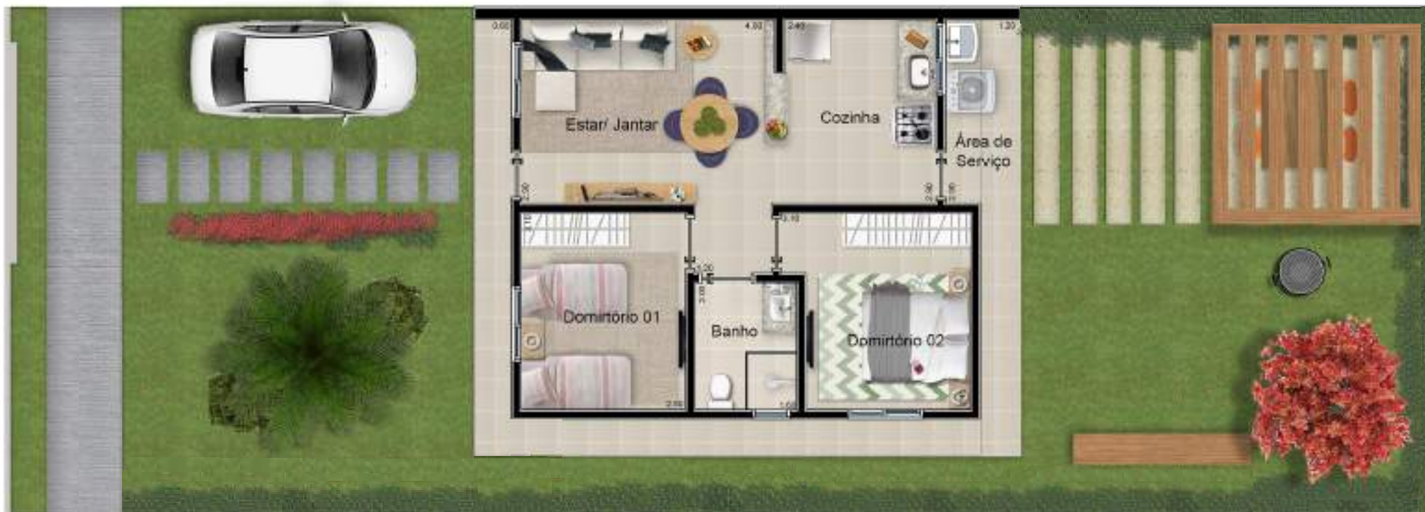
Imagem decorativa e meramente ilustrativa. As casas serão entregues de acordo com o projeto aprovado pela Prefeitura e Caixa Econômica Federal.