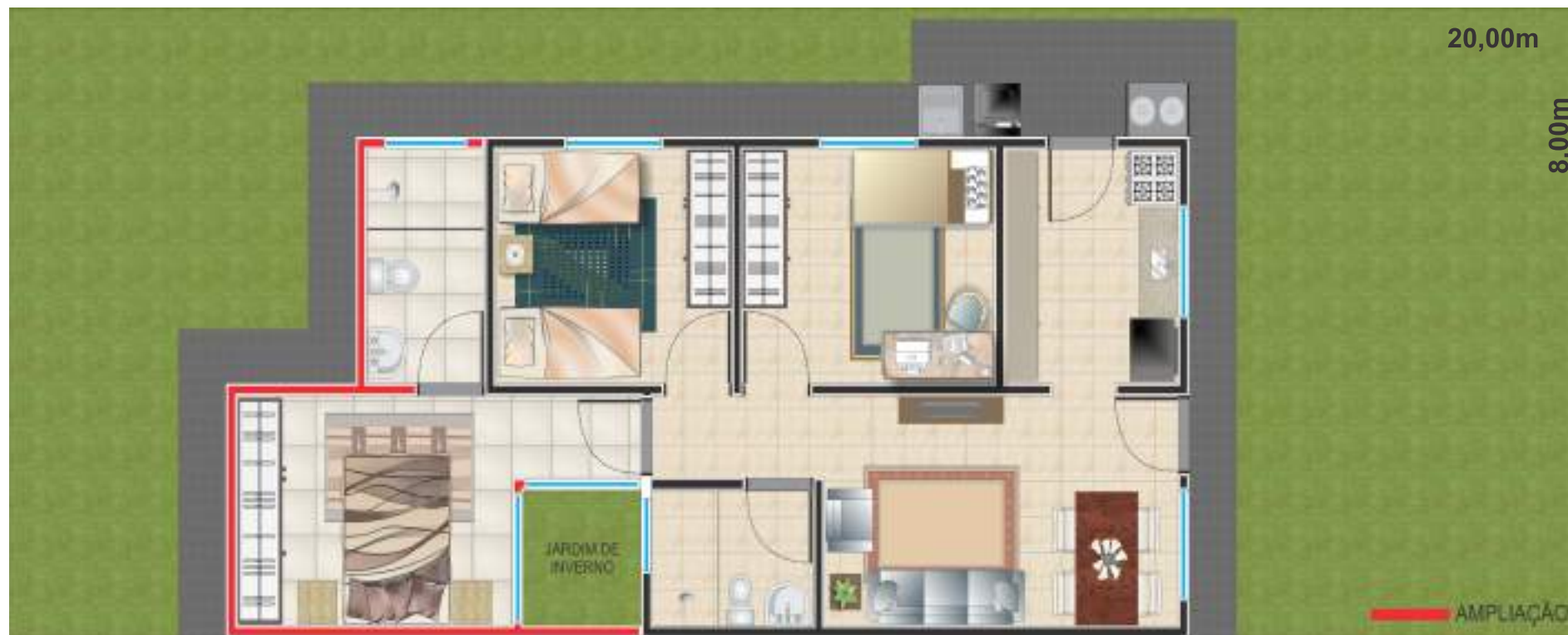
Imagem decorativa e meramente ilustrativa, utilizada como sugestão de ampliação.. As casas serão entregues de acordo com o projeto aprovado pela Prefeitura e Caixa Econômica Federal.