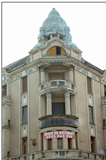
Cupola și balconul caracteristice secesionului vienez