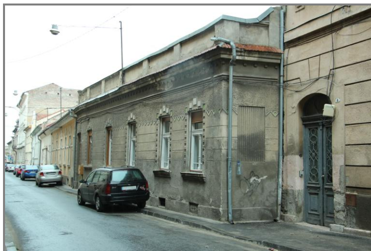
Sediul fostului Club sportiv Hakoah

Culorile clubului au fost reprezentate de către mai mulți campioni naționali la tenis de masă, gimnastică, natație și atletism. Avea și o echipă de fotbal destul de populară. Clubul sportiv a fost desființat în 1940.