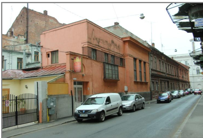
Vecinii palatului Bohus de pe strada Zrinyi (Vasile Goldiș): Clubul Llyod și fosta cantină socială

Comercializarea publicației care era una semnificativă și din punct de vedere al publicității aducea venituri frumoase și odată cu acestea creștea și lista susținătorilor cauzei (Lanevschi, pag.106).