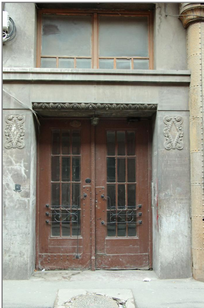
Una dintre porțile decorate dinspre strada Zrinyi (astăzi Vasile Goldiș)