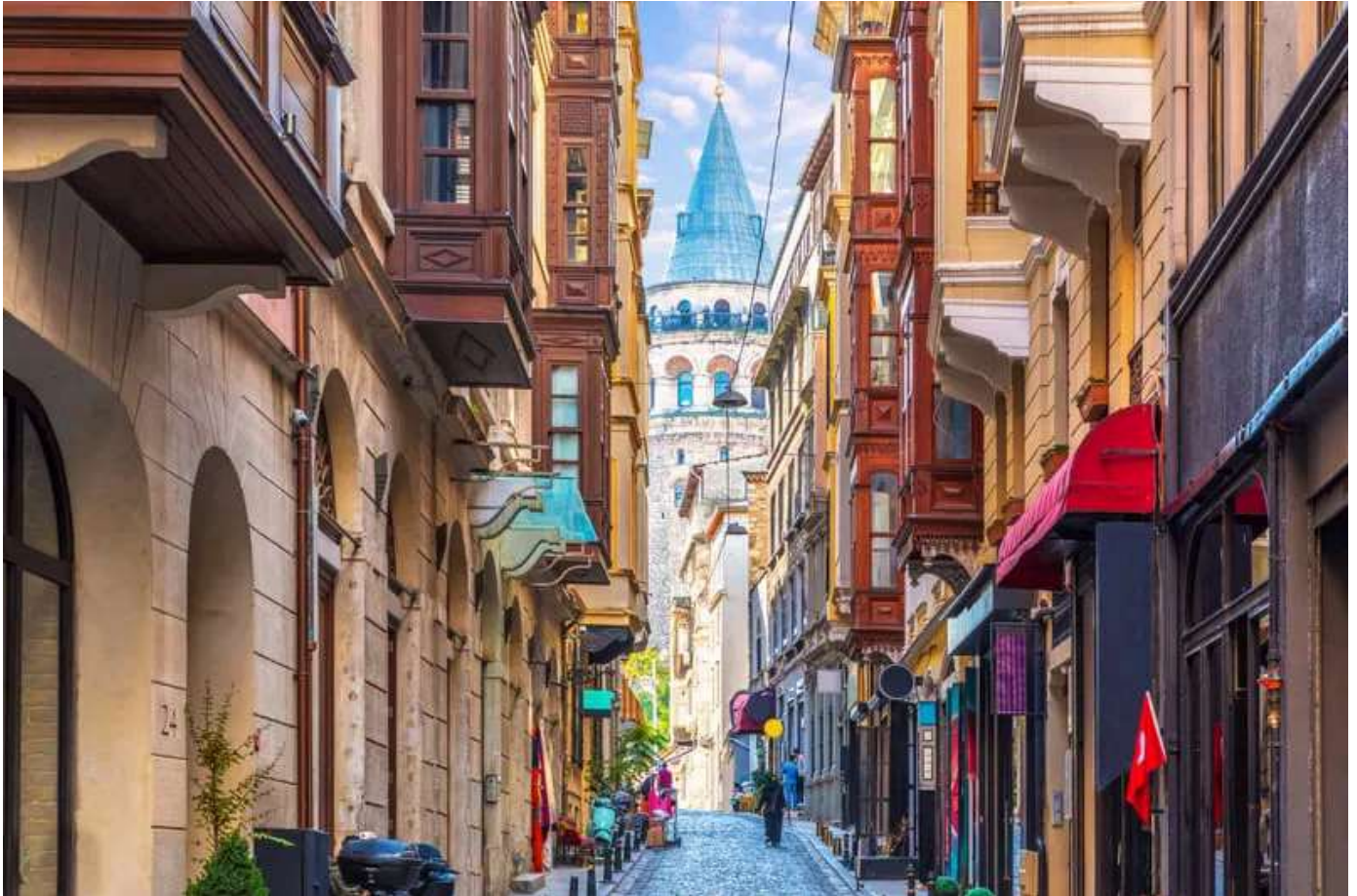
ΑΝΑΧΩΡΗΣΗ 1-3 ΜΑΡΤΙΟΥ 2025