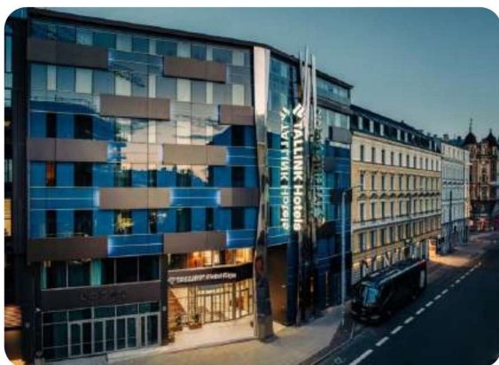
TALLINK HOTEL RIGA