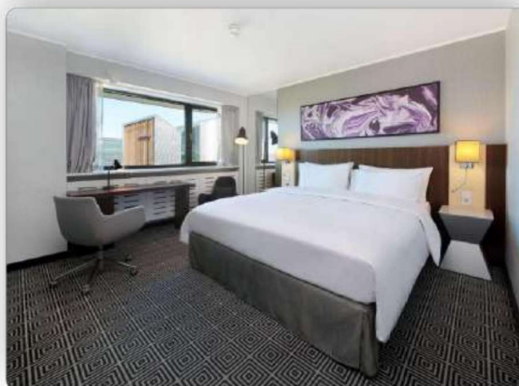
RADISSON BLU VILNIUS