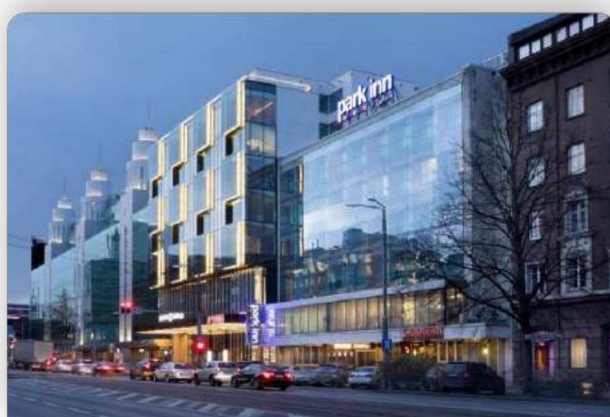
PARK INN BY RADISSON TALLIN