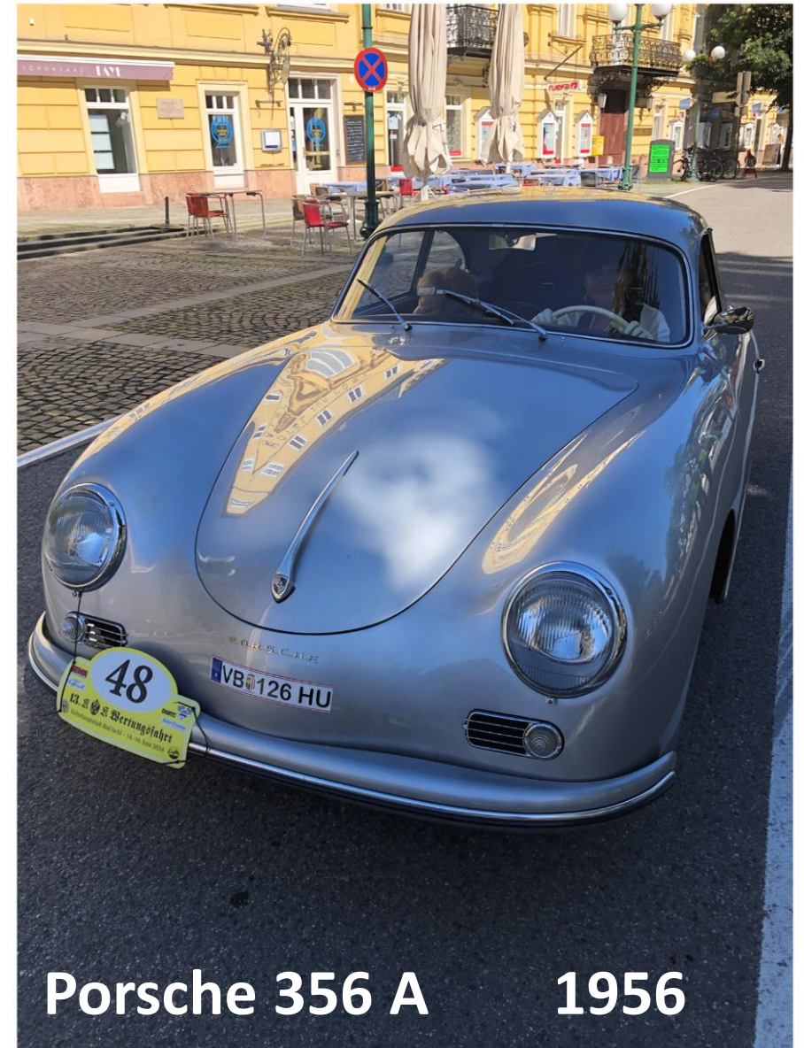
Porsche 356 A