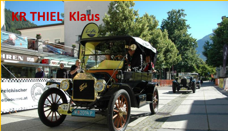
KR THIEL Klaus