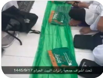
تمت اشراف جمعية زائرات البيت الحرام 1445/9/17