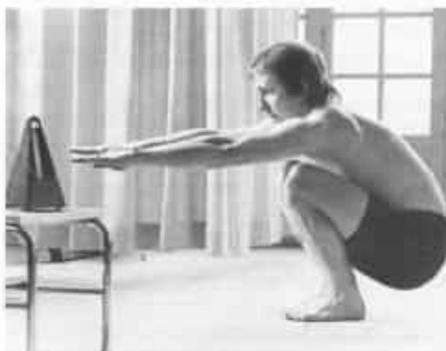
FIG. 1. - Attitude correcte au départ de l'exercice

Tirés à part : J.-P. de MONDENARD, 12, avenue Georges, F 94430 Chennesières-sur-Marne.