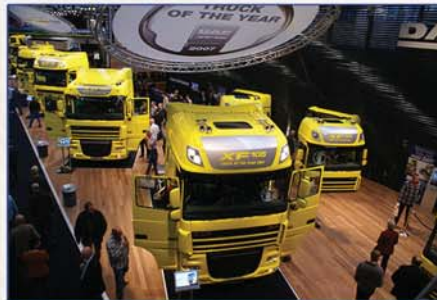
1928-2010: over 80 years of transport innovation