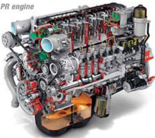
PACCAR PR engine

ولقد عكفت «داف» في السنوات الاخيرات الى تحسين نوعية مصانعها وتجهيزها باحدث اجهزة التصنيع الحديثة ، فحافظت بذلك على تفوقها وسمعتها العالمية. إن مصانع الميكانيك تم تجديدها كلياً ، وتم امدادها بمعدات من نوع «سيمكا» ، وبالنسبة الى الادوات الميكانيكية والتركيب.؛ كما زود مصنع «وسترلو» باحدث تقنيات تصنيع المقصورات للشاحنات ومحاورها. في المقر الرئيسي لكل من شركة «داف» تصنع المحركات والاجزاء الاساسية . أما خط التركيب لطرازي «سي - إف» و«إكس - إف» فيتم في Eindhoven فيما يتم تصنيع المحاور ومقصورات الشاحنات في Westerlo من اعمال بلجيكا. كما يتم تصنيع الشاحنات طراز «إل - إف» للعمل الخفيف والمتوسط في مصانع شاحنات «لبلاند» (شركة باكار) في بريطانيا ، وكذلك ناقلات «سي إف» و «إكس إف 105». كما ان المركز التقني لشركات «داف» يقع في مدينة Eindhoven وهو يحتوي على كل التسهيلات للقيام بابحاث واختبارات شاملة. ، بما في ذلك تسهيلات جد متقدمة لقياس الصوت الذي تصدره الشاحنة. كما تم انشاء مركز جديد لاختبارات الميكانيكية عالي التقنية. ويعتبر هذا المركز الاحدث من نوعه في العالم ، وفيه تجري اختبارات مكثفة على مدى 24 ساعة مدة 7 ايام اسبوعيا ومن دون انقطاع وفي درجات حرارة مختلفة من 20 الى ما فوق 60 درجة مئوية. وبالإضافة الى كل ذلك وتحديداً في Sint-Oedenrode التي تبعد 20 كيلومتراً عن Eindhoven تجري «داف» إختبارات واسعة لمختلف أنواع الناقلات على مساحة من الأرض مخصصة لتلك الاختبارات التي يشرف عليها المهندسون الميكانيكيون والتقنيون المتخصصون للوقوف على حسن أداء تلك الناقلات قبل عرضها في أسواق العرض والطلب في أنحاء العالم.