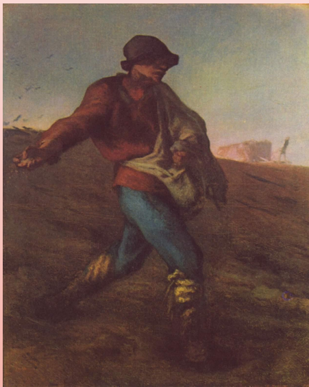
מוזיאון: לאמנויות יפות בוסטון

צייר צרפתי, בנו של איכר. הוא קיבל את הכשרתו אצל צייר מקומי בשרבורג ולאחר מכן בפאריס, בשנת 1837, אצל פול דלרוש. יצירותיו המוקדמות היו בהשראת תמונות פסטורליות של ציירים שונים מן המאה ה-18 ובמידת מה תמונות עירום ארוטיות, אבל לעתים הוא צייר גם דיוקנים. ההשפעה של דומיה נראית מוחלטת, ובשנת 1848 הוא הציג בסלון את "המְנִיָּה".