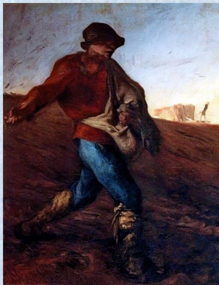
הזורע ז'אן פרנסואה מייה

הוא חזר לנושא ביוני 1888 כאשר צייר נוף עם דמות קטנה של זורע בשדה, הנשלטת על ידי שמש ענקית. במכתבים שנכתבו ביוני הוא התייחס ישירות לזורע של מייה אך הוא התלונן כי הוא חסר צבע. ואן גוך ראה במחזור הטבעי של היבולים, ובמיוחד בזה של החיטה, מטאפורה למחזור חיי אדם: יצירת חיים חדשים, צמיחה, פריחה ולבסוף מוות. הזריעה נתפסה אצלו כסמל להמשכיות החיים.