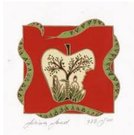
הביס של חוה אמנו