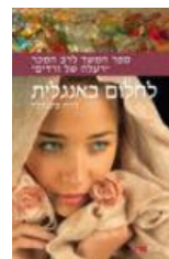
עטיפת הספר "לחלום באנגלית"